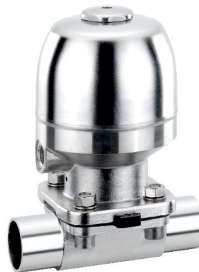
アクチュエーター Ver. T