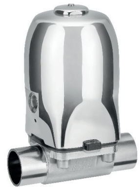
アクチュエーター Ver. D